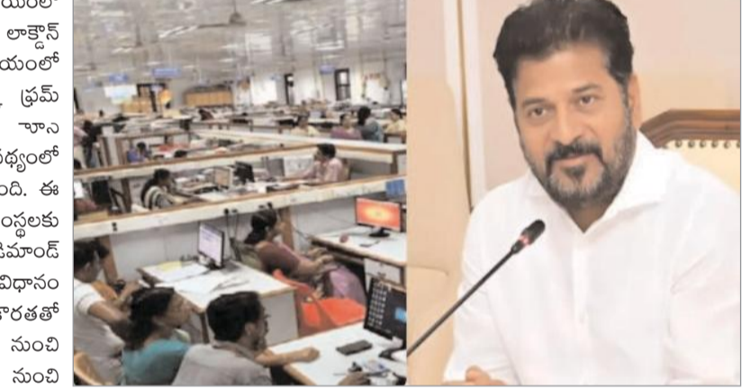
దృష్టిలో పెట్టుకొని వర్క్ ఫ్రమ్ హోమ్ తప్పనిసరి చేస్తూ ప్రభుత్వం ఉత్తర్యలు జారీ చేయాలన్న డిమాండ్ ఉద్యోగుల నుండి బలంగా వినిపిస్తోంది.

: ఇంద్ర అదా, విద్యుత్ కొరత, పెరుగుతున్న ఉష్ణోగ్రతల నేపథ్యంలో ఉద్యోగులు వర్క్ ఫ్రమ్ హోమ్ విధానాన్ని అవలంబించే దిశగా రాష్ట్ర ప్రభుత్వ చర్యలు తీసుకుంటున్నట్లు సమాచారం. ఇప్పటికే వర్క్ ఫ్రమ్ హోమ్ను కొనసాగించాలని, ట్రాఫిక్ సమస్యలను నివారించాలని ఉద్యోగుల సంఘాలు కూడా ప్రభుత్వానికి విజ్ఞప్తి చేస్తున్నాయి. పశ్చిమాసియాలో ఉద్రిక్తతల నేపథ్యంలో ప్రపంచ దేశాలతో పాటు భారత్తోనూ చమురు, గ్యాస్ సరఫరాలో కొరత ఏర్పడిన విషయం తెలిసిందే. ఈ నేపథ్యంలో చమురు కంపెనీలు పెట్రోల్ బంకులకు సరఫరా చేసే పెట్రోల్, డీజిల్ నిబంధనలు మార్చడంతో చాలా రాష్ట్రాల్లో ఇబ్బందులు మొదలయ్యాయి. తెలంగాణ రాజధాని హైదరాబాద్లోనూ పెట్రోల్, డీజిల్ కొరత తీవ్రంగా వేదిస్తోంది. బంకుల వద్ద వాహనదారులు పెట్రోల్, డీజిల్ కోసం గంటల తరబడి బారులు తీరాల్సిన పరిస్థితి నెలకొంది. దేశవ్యాప్తంగా పెట్రోల్, డీజిల్ కొరత తీవ్రతపై అవుతున్న నేపథ్యంలో వర్క్ ఫ్రమ్ హోమ్ డిమాండ్ మళ్లీ తెరపైకి వచ్చింది. గతంలో కరోనా సమయంలో కేంద్ర ప్రభుత్వం దేశవ్యాప్తంగా లాక్డౌన్ విధించింది. ఈ సమయంలో ఉద్యోగులకు కంపెనీలు వర్క్ ఫ్రమ్ హోమ్ ఇచ్చాయి. ప్రస్తుతం ్రాన పెట్రోల్, డీజిల్ కొరత నేపథ్యంలో రవాణా వ్యవస్థ స్తంభించి పోతోంది. ఈ క్రమంలో ప్రభుత్వ ప్రైవేట్ సంస్థలకు వర్క్ ఫ్రమ్ హోమ్ ఇవ్వాలన్న డిమాండ్ వినిపిస్తోంది. వర్క్ ఫ్రమ్ హోమ్ విధానం వల్ల పెట్రోల్, డీజిల్ కొరతతో ఎదురవుతున్న ఇబ్బందుల నుంచి బయటపడడంతోపాటు ఎండల సుందీ రక్షణ పొందొచ్చని, మరోవైపు ట్రాఫిక్ కష్టాలకు చెక్ పెట్టొచ్చని, పొల్యాషన్ తగ్గుతుందని ఉద్యోగ సంఘాలు సూచిస్తున్నాయి. ఎదుర్కొంటున్న ఇబ్బందులను