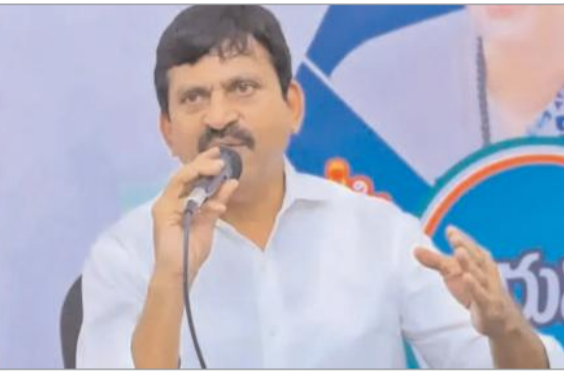
అమలులోకి తీసుకొస్తామని చెప్పారు. ఈ ధరల సవరణ ద్వారా అటు ప్రభుత్వ ఆదాయం పెరగడంతో పాటు, ఇటు రియల్ ఎస్టేట్ రంగానికి పారదర్శకత చేకూరుతుందని భావిస్తున్నారు. అర్హులైన లబ్ధిదారుల ఎంపికను ఎక్కడా రాజకీయ జోక్యం లేకుండా గ్రామసభల ద్వారానే పారదర్శకంగా నిర్వహిస్తామని మంత్రి పునరుద్ఘాటించారు.

పథకం కింద నిధులు మంజూరు చేసి, ఇందిరమ్మ ఇళ్లుగా పూర్తి చేస్తామని మంత్రి పొంగులేటి ప్రకటించారు. దీనితో పాటు, పట్టణ మరియు గ్రామీణ ప్రాంతాల్లో స్థలాభావం ఉన్న కుటుంబాల కోసం ఒకే స్థలంలో అన్నదమ్ములు ఉమ్మడిగా జీవించేలా '1o1' (జీ వన్ వన్) పద్ధతిలో ఇళ్లు నిర్మించుకునే సరికొత్త ప్రతిపాదనను కూడా ప్రభుత్వం పరిశీలిస్తోందని, దీనిపై త్వరలోనే స్పష్టమైన మార్గదర్శకాలు వస్తాయని వెల్లడించారు. ఈ నెలాఖరులోగా భూముల ప్రభుత్వ విలువల సవరణ ఇళ్ల నిర్మాణ వెసులుబాటుతో పాటు రాష్ట్రంలో భూముల మార్కెట్ ధరల (రిజిస్ట్రేషన్ విలువల) సవరణపై కూడా మంత్రి కీలక అప్ డేట్ ఇచ్చారు. రాష్ట్రవ్యాప్తంగా ఉన్న భూముల ప్రభుత్వ ధరలను శాస్త్రీయంగా సవరించే ప్రక్రియ వివిధ దశకు చేరుకుందని, ఈ నెలాఖరు నాటికి నూతన భూముల ధరలను ఖరారు చేసి అధికారికంగా