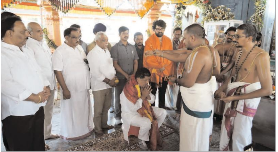
ఉంటూ ప్రజలకి బిఆర్ఎస్ పార్టీలో జరిగిన అభివృద్ధి కార్యక్రమాలను వివరిస్తూ మనం ముందుకు వెళదామని, అలాగే ఈ నెల 25వ తారీఖున బిఆర్ఎస్ పార్టీ వర్కింగ్ ప్రెసిడెంట్ కేటీఆర్ సారధ్యంలో కూకట్ పల్లి నియోజకవర్గంలోని కార్యకర్తల సమావేశానికి పెద్ద ఎత్తున తరలివచ్చి జయప్రదం చేయాలని.. తిరిగి మళ్ళీ భవిష్యత్తులో కెసీఆర్ ని ముఖ్యమంత్రిగా చేసుకుని తెలంగాణ రాష్ట్రాన్ని ఆదర్శ రాష్ట్రంగా తీర్చిదిద్దుకుందాం అని పిలుపునిచ్చారు. వైభవంగా శ్రీవేంకటేశ్వర స్వామి బ్రహ్మోత్సవాలు కే.పి.హెచ్.బి