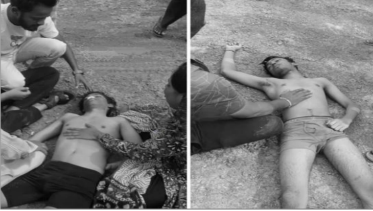
పోలీసులు కేసు నమోదు చేసుకుని, మృతికి గల పూర్తి కారణాలపై దర్యాప్తు చేస్తున్నారు.

ప్రాణాలు విడిచారు. ఈ ప్రమాదంపై సమాచారం అందుకున్న వేములవారి పోలీసులు తక్షణమే సంఘటనా స్థలానికి చేరుకున్నారు. స్థానికుల సహాయంతో మృతదేహాలను నీటి నుండి వెలికితీసి, క్షుణ్ణంగా పరిశీలించారు. ?ఈ విషాద వార్త తెలియగానే మృతుల కుటుంబ సభ్యులు, బంధువులు సంఘటనా స్థలానికి చేరుకొని, కన్నీరుమున్నీరుగా విలపిస్తున్నారు. చేతికందివచ్చిన కొడుకులు కళ్లముందే శవాలుగా మారడంతో, ఆయా కుటుంబాల్లో గుండెకోత మిగిలింది. యువకుల మృతితో కొడుముంజ గ్రామంలోనూ, మృతుల స్వగ్రామాల్లోనూ విషాద ఛాయలు అలుముకున్నాయి. ఈ ఘోర ప్రమాదంపై