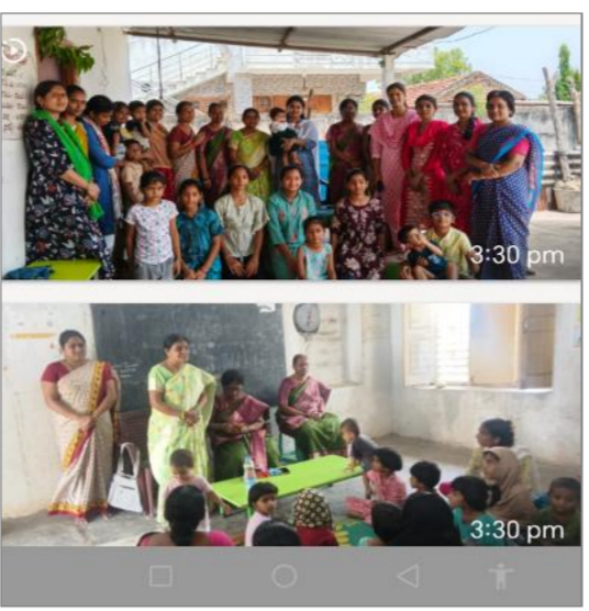
ప్రీసూల్ పిల్లలు మరియు తల్లులు పాల్గొనడం జరిగింది