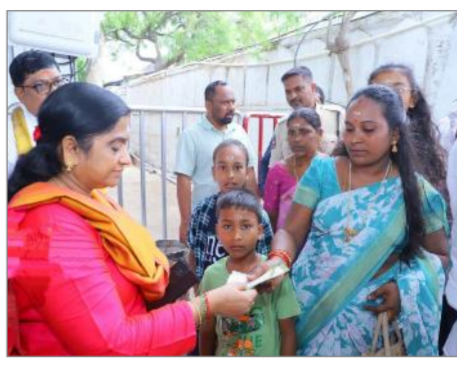
రాజస్థాని సినిమా జిల్లా, జూన్ 08, ఇంద్రప్రభ: ప్రముఖ పుణ్యక్షేత్రమైన వేములవాడ శ్రీ రాజరాజేశ్వర స్వామి దేవస్థానం అనుబంధాలయమైన శ్రీ భీమేశ్వర స్వామి ఆలయం సోమవారం రోజున భక్తులతో కిక్కిరిసిపోయింది. స్వామివారికి అత్యంత ప్రీతిపాత్రమైన సోమవారం కావడం, మరోవైపు వేసవి సెలవులు ముగుస్తుండటంతో ఉదయం నుంచే భక్తులు భారీ సంఖ్యలో ఆలయానికి తరలివచ్చారు. ముందుగా