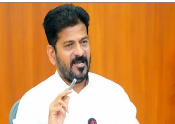
ప్రధాన ప్రతిపక్ష బీఆర్ఎస్ (డి.సా) సైతం ముఖ్యమంత్రి తీరును తీవ్రంగా ఖండించింది. అటు సోషల్ మీడియా వేదికగా కూడా సీఎం వ్యాఖ్యలపై నెటిజన్లు భిన్న శైలిలో ట్రోల్స్, విమర్శలు గుప్పిస్తున్నారు.

చేశాను" అని సీఎం వివరించారు. అయితే సీఎం రేవంత్ రెడ్డి చెప్పిన హిట్లర్ కథనంలో చారిత్రక వాస్తవాల తేవని నిపుణులు గుర్తుచేస్తున్నారు. రెండో ప్రపంచ యుద్ధ కాలంలో హిట్లర్ నాజీ సైన్యంలో 'హైద్రా' పేరిట ఎలాంటి హంతక బృందాలు లేవని, నిజానికి నాజీ జర్మనీని దెబ్బతీయడానికి బ్రిటన్ వైమానిక దళం (=ఝాఫీ) చేపట్టిన ఒక ప్యూహాత్మక బాంబు దాడి ఆపరేషన్కు 'ఆపరేషన్ హైద్రా' అని పేరుపెట్టిన చరిత్రకారులు స్పష్టం చేస్తున్నారు. ఈ వ్యాఖ్యలపై భారతీయ జనతా పార్టీ (డిజ్) జాతీయ స్థాయిలో తీవ్రంగా స్పందించింది. ఇది కాంగ్రెస్ పార్టీ రక్తంలోనే ఉన్న 'హిట్లర్, ఎమ్మర్సెన్స్ మనస్తాస్థానిక' పరాకాష్ఠ అని బీజేపీ జాతీయ అధికార ప్రతినిధి షేహజాద్ పునావాలా ధ్వజమెత్తారు. దీన్ని పక్కా 'నియంతృత్వ పోకడ'గా అభివర్ణించిన ఆయన.. గతంలో ఇందిరా గాంధీ విధించిన ఎమ్మర్సెన్స్ రోజులను రేవంత్ వ్యాఖ్యలు గుర్తుచేస్తున్నాయన్నారు. అటు