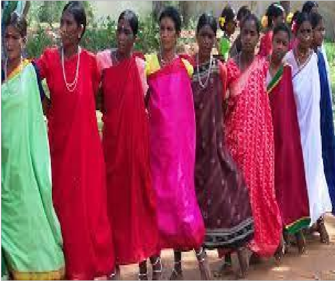
/ జహాజ్ బేనోద్ / కొయ్ సవాల్ కర్ / ఉన్ జైల్ బేజ్ దో!!

ఈ దేశంలో ఆదివాసీ హక్కులను నీరు గార్చిన పార్టీ, అంటే హక్కుల చట్టాన్ని దారుణంగా దెబ్బతీసిన పార్టీ, రిజర్వేషన్లకు గండికొట్టిన పార్టీ, గుజరాత్ లో ముస్లింలను ఊచకోత కోసిన పార్టీ, సుప్రీంకోర్టు తీర్పు అనే గంగా జలంతో మోడిని కడిగిన ముత్యంలా బయటికి తెచ్చుకున్న పార్టీ, లోగడ హిందూ సంప్రదాయాన్ని వెత్తికెత్తుకున్న ఓ ముస్లిం - (కలాం) దేశాధ్యక్షుడిగా చేసిన పార్టీ... ఇప్పుడు తమ రాజకీయ ప్రయోజనాల కోసం వెతికి వెతికి ఓ ఆదివాసీ మహిళను అధ్యక్ష పదవికి నిలబెట్టుకుంది. వీటన్నింటి వెనక ఉన్న కుట్రకొణాన్ని ప్రజలు అర్థం చేసుకుంటున్నారు. దేశాధ్యక్ష పదవికి ద్రోహిణి ముర్రును నిలబెట్టిన పార్టీ దేశ ప్రజలకు చాలా విషయాలు చెబుతుంది. ఆదివాసీ మహిళ అని గొంతెత్తి చెప్పడమే గానీ, ఆమె కనీసం ఆదివాసీలకు ఏం చేసిందో చెబుతుంది. ఎమ్మెల్యేగా, మంత్రిగా, గవర్నర్ గా పనిచేసిన ఆమె తన స్వంత ఊరికి కనీసం కరెంటు ఇప్పించలేదు. ఆమె అధ్యక్ష పదవికి నామినేషన్ చేసిన మరునాడు ఇక పరువు పోతుందని తొందరపడి ఒడిశాలోని మయూర్ భంజ్ జిల్లా కుసుం సమితిలోని ఆమె స్వగ్రామం ఉపరెవెన్యూ-లో విద్యుత్ ప్రణాళి ఏర్పాటుకు గోతులు తవ్వారు. స్వాతంత్ర్యం లభించిన దెబ్బి అయిందేం తర్వాతనా ఆ ఊరికి విద్యుత్ వెలుగులు అందేదీ? 2006 జనవరి 2న ఒడిశాలోని కలింగ్ గర్లో ఓ సంఘటన జరిగింది. అక్కడ టాలూ స్ట్రీట్ ప్లాంలో కోసం ఆదివాసీల భూమిని లాక్కూన్నారు. ఆదివాసీలు తిరగబడ్డారు. అక్కడ అప్పుడు అధికారంలో ఉన్న బీజేపీ-బీజేపీ సంయుక్త కూటమి ప్రభుత్వం పోలీసు కాల్పులు జరిపించింది. పదమూడు మంది గిరిజనులు తూటాలకు బలయ్యారు. ఆ ప్రభుత్వంలో ద్రోహిణి ముర్రు మంత్రిగా ఉండికూడా నోరు మెదపలేదు. ఇక ఈమె మోడి భజన చేయడం తప్ప దేశ ప్రజల గూర్చి ఆలోచిస్తుందని ఎవరనుకుంటారు?