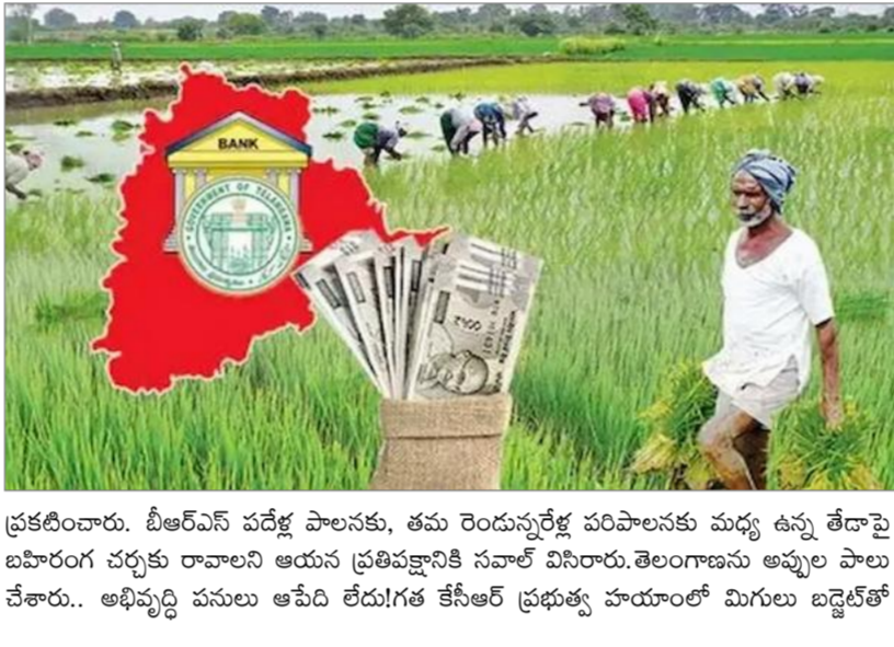
ప్రకటించారు. బీఆర్ఎస్ వద్దే పాలనకు, తమ రెండున్నరేళ్ల పరిపాలనకు మధ్య ఉన్న తేడాపై బహిరంగ చర్చకు రావాలని ఆయన ప్రతిపక్షానికి సవాల్ విసిరారు. తెలంగాణను అప్పుల పాలు చేశారు.. అభివృద్ధి పనులు ఆపేది లేదు!గత కేసీఆర్ ప్రభుత్వ హయాంలో మిగులు బడ్జెట్తో

తెలంగాణలోని అన్నదాతలకు రాష్ట్ర ప్రభుత్వం తీవ్ర కబురు అందించింది. రాజోమ్ తొమ్మిది రోజుల్లో రైతుల ఖాతాల్లో రూ. 9,000 కోట్ల రైతు భరోసా నిధులను నేరుగా జమ చేయనున్నట్లు ముఖ్యమంత్రి ఎ. రేవంత్ రెడ్డి వెల్లడించారు. హైదరాబాద్ లో మంగళవారం జరిగిన ఒక భారీ బహిరంగ సభలో ఆయన ఈ నిధుల విడుదలకు శ్రీకారం చుట్టారు. ప్రస్తుత వర్షాభావ పరిస్థితులను దృష్టిలో ఉంచుకుని, వ్యవసాయ శాఖ సిఫార్సు చేసిన ఏడు రకాల అధిక దిగుబడినిచ్చే పరి మంగడాలనే రైతులు సాగు చేయాలని సీఎం ఈ సందర్భంగా కోరారు. నిధుల కొరత లేదు. గత 30 నెలల్లో రూ. 20,000 కోట్ల రుణమాఫీ/రైతు భరోసా పథకానికి అవసరమైన బడ్జెట్ అందుబాటులో ఉందని, రైతు వేదికల ద్వారా నాణ్యమైన పరి విత్తనాలను పంపిణీ చేసేందుకు సిద్ధంగా ఉంచామని ముఖ్యమంత్రి స్పష్టం చేశారు. తమ ప్రభుత్వం అధికారంలోకి వచ్చిన గత 30 నెలల కాలంలో అన్నదాతల సంక్షేమానికి పెద్దపీట వేసిందని ఆయన వివరించారు. ఇప్పటివరకు 25.35 లక్షల మంది రైతులకు ప్రయోజనం చేకూరుస్తూ రూ. 20,000 కోట్ల వ్యవసాయ రుణాలను మాఫీ చేశామని గుర్తుచేశారు. రైతు భరోసా కింద ఇప్పటికా రూ. 36,000 కోట్లు అందించామని, ఇందులో తాము వగ్గాలు చేపట్టగానే ఇచ్చిన రూ. 7,000 కోట్లు కూడా ఉన్నాయని తెలిపారు. ప్రభుత్వం రైతు సంక్షేమం కోసం నెలకు కేవలం రూ. 2,000 కోట్లు మాత్రమే ఖర్చు చేస్తే, తమ కాంగ్రెస్ ప్రభుత్వం నెలకు ఏకంగా రూ. 6,000 కోట్లు వెచ్చిస్తోందని సీఎం రేవంత్ రెడ్డి గణాంకాలతో వివరించారు. రైతు సమస్యలపై చర్చించేందుకు శాసనసభ ప్రత్యేక సమావేశాన్ని ఏర్పాటు చేసేందుకు తాము సిద్ధంగా ఉన్నామని