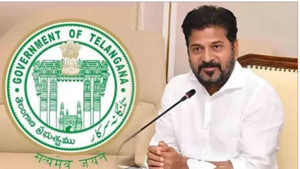
ఉన్న మైనారిటీ సంక్షేమ శాఖ కార్యాలయాన్ని సంప్రదించవచ్చు. అక్కడ అధికారులు పూర్తి మార్గదర్శకాలు అందిస్తారు. అభ్యర్థులు సరైన ధృవీకరణ పత్రాలతో దరఖాస్తు చేసుకుంటే లబ్ధి పొందే అవకాశం ఉంటుంది. ఈ పథకం ద్వారా లభించే సదుపాయాలను సద్వినియోగం చేసుకోవడం మంచిది.

తెలంగాణ రాష్ట్రంలోని క్రీస్టియన్ మైనారిటీ వర్గాల ఆర్థిక పురోగతి కోసం ప్రభుత్వం ప్రత్యేక స్వయం ఉపాధి పథకాలు ప్రవేశపెట్టింది. ఈ పథకాల ద్వారా కుట్టు మిషన్లు, చిన్న తరహా వ్యాపార యూనిట్లు, ఈ-బైకులు, ఈ-స్కూటీలు, మోటార్ బైకుల కోసం ఆర్థిక సహాయం అందుతుంది. తెలంగాణ క్రీస్టియన్ మైనారిటీ స్వయం ఉపాధి పథకాలు పొందేందుకు అర్హులైన వారు ఆన్ లైన్ లో దరఖాస్తు చేసుకోవాలి. మైనారిటీ శాఖ మంత్రి మహమ్మద్ అజారుద్దీన్ పోర్టల్ ప్రారంభించి అర్హులైన వారందరూ ఈ అవకాశాన్ని సద్వినియోగం చేసుకోవాలని కోరారు. ఆర్థికంగా స్వతంత్రంగా ఎదగడానికి ఇది ఒక మంచి అవకాశం. ప్రభుత్వ పథకాలు పొందడానికి కొన్ని నిబంధనలు ఉన్నాయి. కుట్టు మిషన్లు, చిన్న వ్యాపార యూనిట్ల కోసం దరఖాస్తు చేసే వారు 21 నుండి 55 సంవత్సరాల మధ్య వయసు కలిగి ఉండాలి. ఈ-బైక్, ఈ-స్కూటీ, మోటార్ బైక్ కోసం దరఖాస్తు చేసే వారు 21 నుండి 50 సంవత్సరాల మధ్య వయసు కలిగి ఉండాలి. పట్టణ ప్రాంతాల్లో నివసించే వారి కుటుంబ వార్షిక ఆదాయం 2 లక్షల లోపు ఉండాలి. గ్రామీణ ప్రాంతాల్లో నివసించే వారి వార్షిక కుటుంబ ఆదాయం 1.5 లక్షల లోపు ఉండాలి. ఈ నిబంధనలకు అనుగుణంగా ఉన్న వారు మాత్రమే దరఖాస్తుకు అర్హులు. దరఖాస్తు ప్రక్రియ జూలై 3 ప్రారంభమైంది. అభ్యర్థులు జూలై 18 సాయంత్రం 5 గంటలలోపు ఆన్ లైన్ వెబ్ సైట్ ద్వారా తమ పేర్లను నమోదు చేసుకోవాలి. గడువు సమయం ముగిసేలోపు దరఖాస్తు పూర్తి చేయడం చాలా అవసరం. మరిన్ని వివరాల కోసం ప్రతి జిల్లాలో