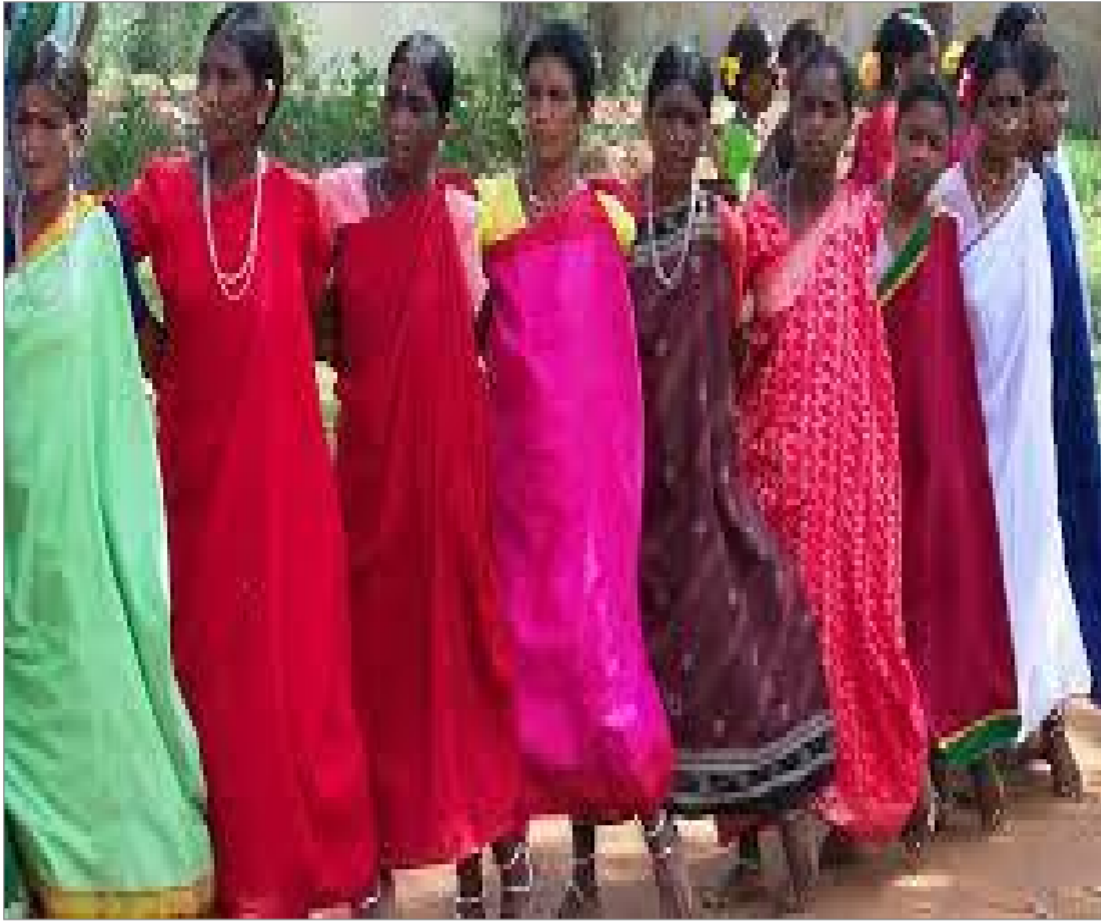
/ జహాజ్ బేనోద్ / కొయి సవాల్ కర్ / ఉన్ జైల్ బేజ్ దో!!

ఈ దేశంలో ఆదివాసీ హక్కులను నీరు గార్చిన పార్టీ, అంటే హక్కుల చట్టాన్ని దారుణంగా దెబ్బతీసిన పార్టీ, రిజర్వేషన్లకు గండికొట్టిన పార్టీ, గుజరాత్ లో ముస్లింలను ఊచకోత కోసిన పార్టీ, సుప్రీంకోర్టు తీర్పు అనే గంగా జలంతో మోడిని కడిగిన ముత్యంలా బయటికి తెచ్చుకున్న పార్టీ, లోగడ హిందూ సంప్రదాయాన్ని వెత్తికెత్తుకున్న ఓ ముస్లిం - (కలాం) దేశాధ్యక్షుడిగా చేసిన పార్టీ... ఇప్పుడు తమ రాజకీయ ప్రయోజనాల కోసం వెతికి వెతికి ఓ ఆదివాసీ మహిళను అధ్యక్ష పదవికి నిలబెట్టుకుంది. వీటన్నిటి వెనక ఉన్న కుట్రకొణాన్ని ప్రజలు అర్థం చేసుకుంటున్నారు. దేశాధ్యక్ష పదవికి ద్రోపతి ముర్రును నిలబెట్టిన పార్టీ దేశ ప్రజలకు చాలా విషయాలు చెప్పదు. ఆదివాసీ మహిళ అని గొంతెత్తి చెప్పడమే గానీ, ఆమె కనీసం ఆదివాసీలకు ఏం చేసిందో చెప్పదు. ఎమ్మెల్యేగా, మంత్రిగా, గవర్నర్ గా పనిచేసిన ఆమె తన స్వంత ఊరికి కనీసం కరెంటు ఇప్పించలేదు. ఆమె అధ్యక్ష పదవికి నామినేషన్ చేసిన మరునాడు ఇక పరువు పోతుందని తొందరపడి ఒడిశాలోని మయూర్ భంజ్ జిల్లా కుసుం సమితిలోని ఆమె స్వగ్రామం ఉపబెడ-లో విద్యుత్ ప్రణాళి ఏర్పాటుకు గోతులు తవ్వారు. స్వాతంత్ర్యం లభించిన దెబ్బి అయిందేం తర్వాతనా ఆ ఊరికి విద్యుత్ వెలుగులు అందేదీ? 2006 జనవరి 2న ఒడిశాలోని కలింగ్ గర్లో ఓ సంఘటన జరిగింది. అక్కడ టాలూ స్ట్రీట్ ప్లాంట్ కోసం ఆదివాసీల భూమిని లాక్కొన్నారు. ఆదివాసీలు తిరగబడ్డారు. అక్కడ అప్పుడు అధికారంలో ఉన్న బీజేపీ-బీజేపీ సంయుక్త కూటమి ప్రభుత్వం పోలీసు కాల్పులు జరిపించింది. పదమూడు మంది గిరిజనులు తూటాలకు బలయ్యారు. ఆ ప్రభుత్వంలో ద్రోపతి ముర్రు మంత్రిగా ఉండికూడా నోరు మెదపలేదు. ఇక ఈమె మోడి భజన చేయడం తప్ప దేశ ప్రజల గూర్చి ఆలోచిస్తుందని ఎవరనుకుంటారు?